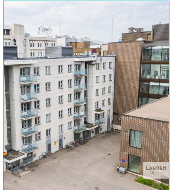
Vapaudenkatu 28, yksi rakennuksista, joka on jälkiasennettu käyttämällä Energiavalintaa.

Suomalainen kaupunki on jo vähentänyt kasvihuonepäästöjä 70 prosentilla vuoden 1990 tasosta. Jatkaakseen kohti hiilineutraalia kaupunkia Lahti käynnisti hankkeen Energiavalinta vuonna 2016. Sen tarkoituksena on auttaa kansalaisia vähentämään hiilidioksidipäästöjä muuttamalla energiantuotannon fossiilisista polttoaineista uusiutuviin ja ympäristöstävällisempiin lähteisiin. Hanke sisältää tietoja ja käytännön todisteita kansalaisten kiinteistöjen mahdollisista taloudellisista ja hiilidioksidisäästöistä. Se kohdistui Lahteen ja Lappeenrantaan.